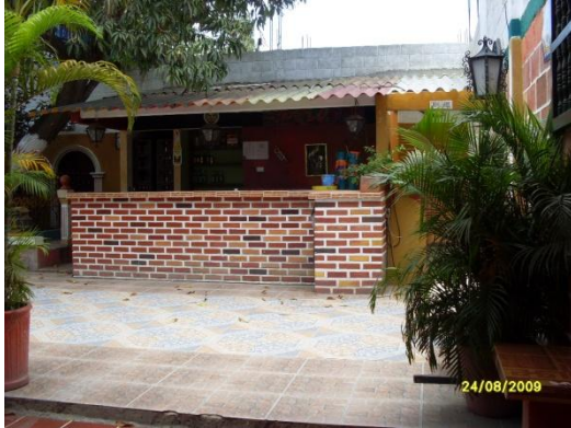
EL RINCON DE LA SALSA